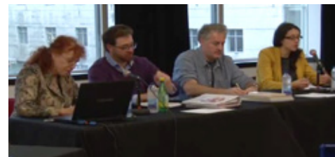
Extrait de la captation vidéo du Midi des nations

► Captation vidéo disponible sur YouTube: www.youtube.com/watch?v=FQ6tIE2Mhb4