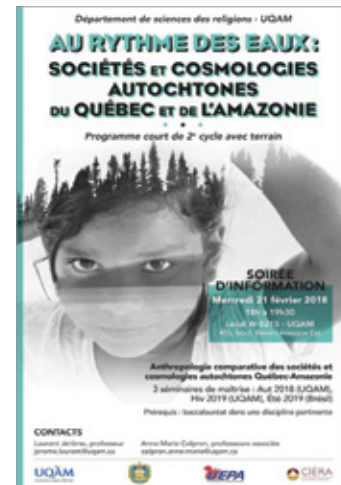
Affiche programme court Amazonie-Québec