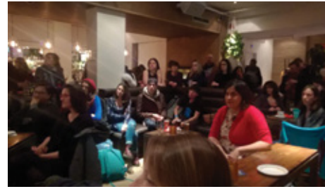
Lancement du CIÉRA-MTL